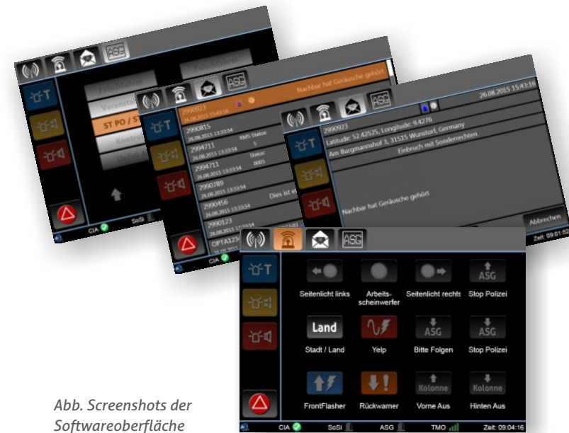
Abb. Screenshots der Softwareoberfläche