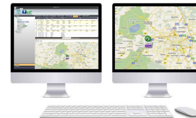
Abb. Leitstellen-Demo-Software mit Karte