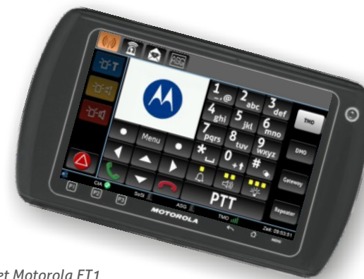
Abb. Tablet Motorola ET1