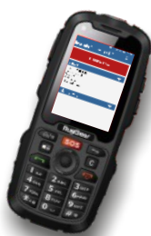
Abb. App-Darstellung auf Mobiltelefon