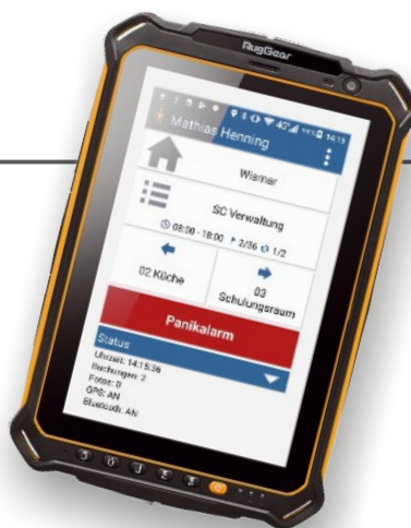
Abb. App-Darstellung auf Tablet