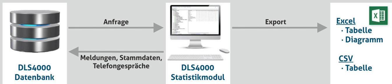
Abb. Systemskizze DLS4000 Statistikmodul